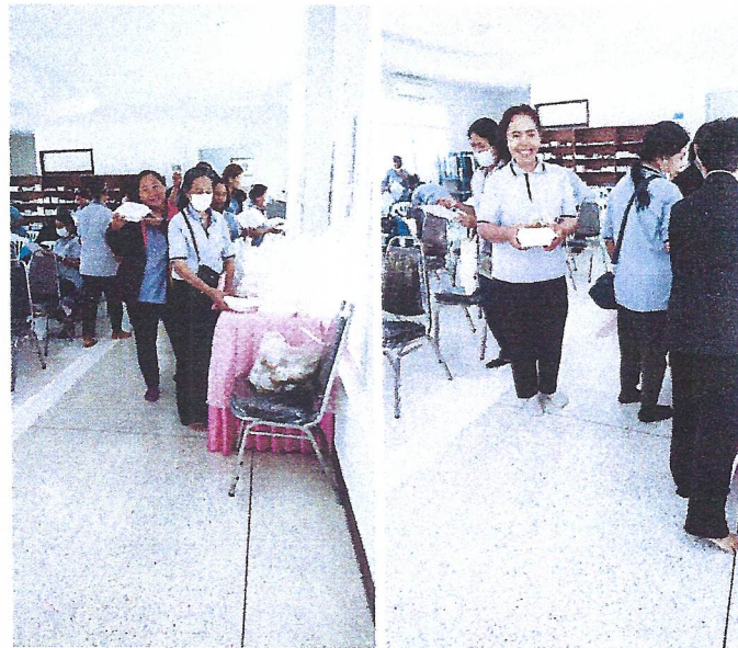
พักรับประทานอาหารกลางวัน