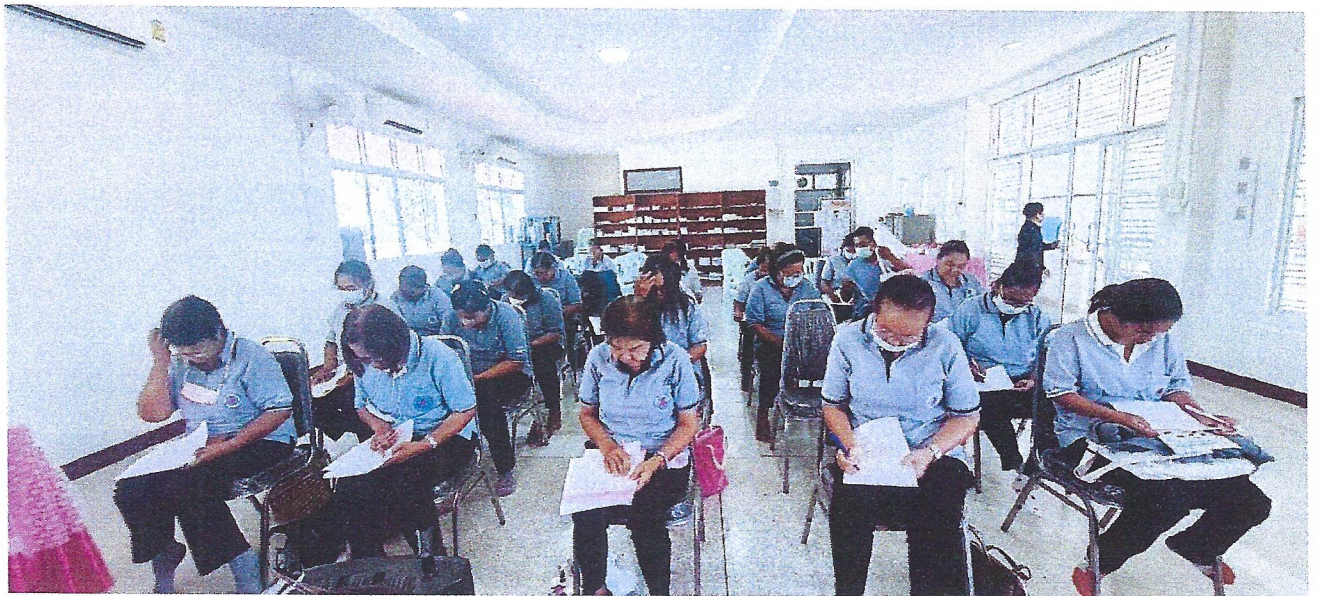
ทำแบบทดสอบ ประเมินความรู้ความเข้าใจ