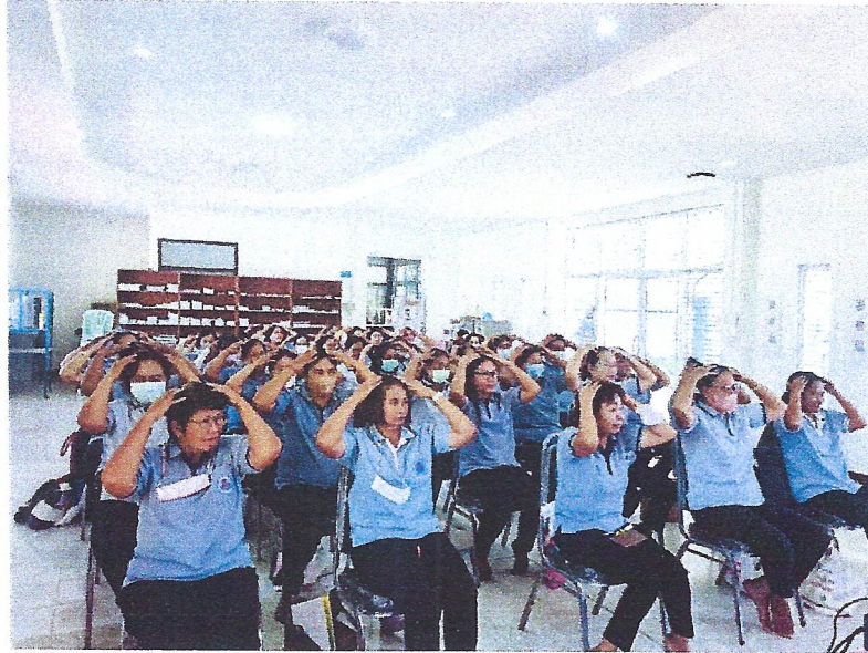
ดำเนินการอบรมต่อ โดยวิทยากร