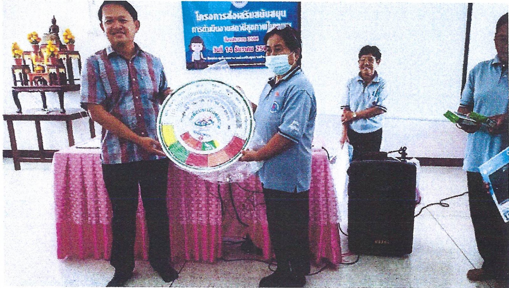
มอบเครื่องมือสนับสนุนการดำเนินงานสถานีสุขภาพ