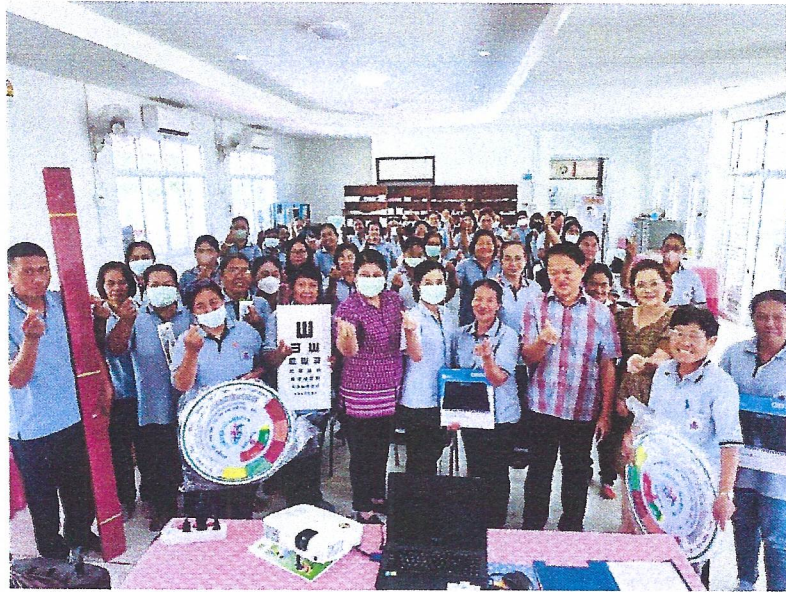
ปิดกิจกรรมถ่ายภาพร่วมกัน