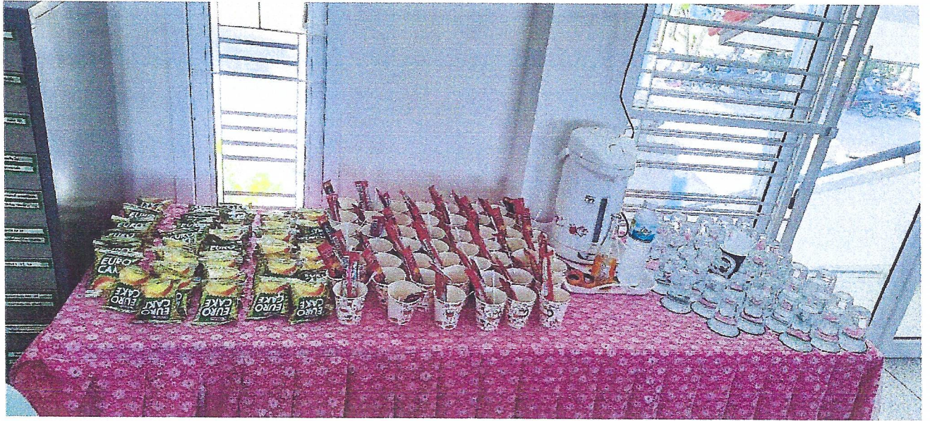
พักรับประทานอาหารว่าง