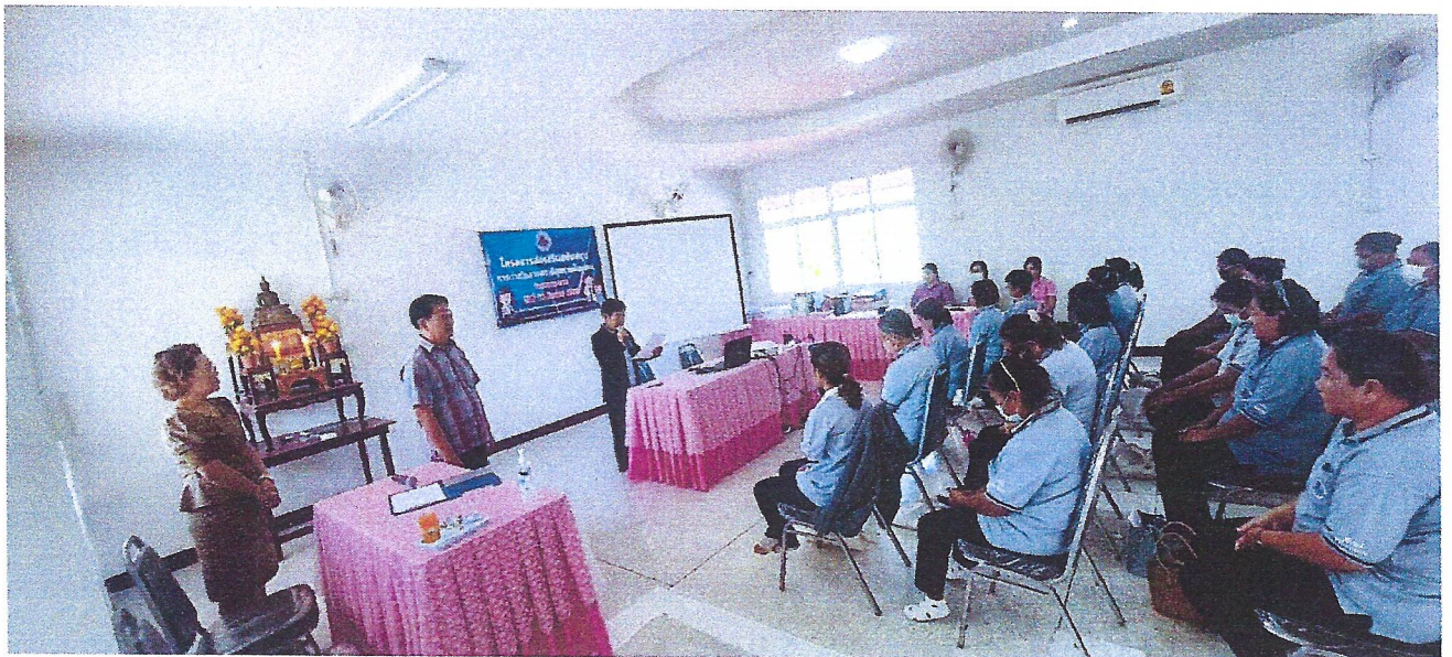
กล่าวรายงาน โดยประธานชมรม อสม.รพ.สต.บ้านนาบัว